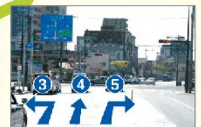
3 小倉方面 4 レトロ 5 関門トンネル