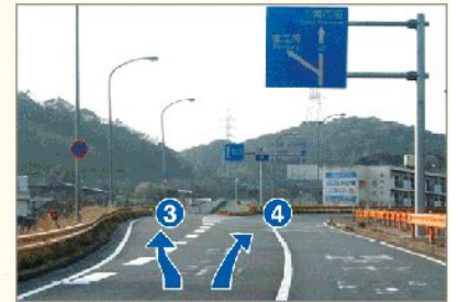
3 壺之浦方面 4 下関市街方面