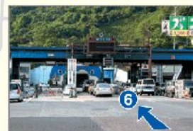
6 関門トンネル入口