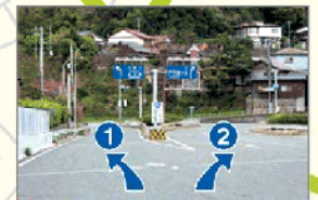
1 白野江方面 2 門司港市街方面