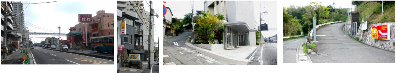
敦煌の左斜め前の信号の10m先、建物の2階外壁に小さな看板。その5m先、マンション手前を左へ。その坂を登り、右へ進む。

なお、「下関IC」からは、D1.D2.D3または、E1.E2と進んで、国道9号線沿いの看板の先5m左側の坂を上り、右側に入ってください(F1)。幹線道路で信号のない所ですから、右折進入のEルートよりも左折進入のDルートの方をお奨めします。お帰りの際は、F2で9号線に入ってください。