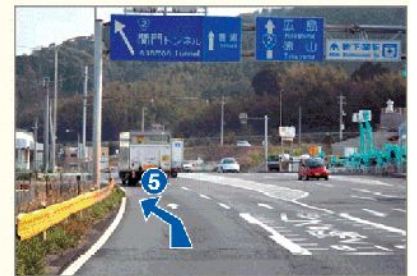
5 関門トンネル方面